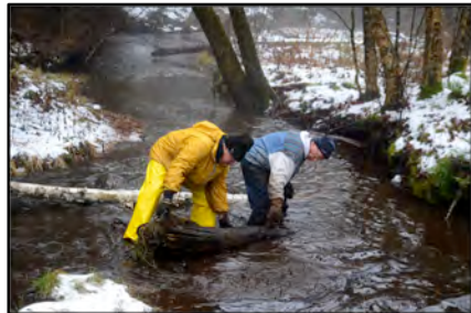
D'autres se mouillent pour nettoyer les tributaires